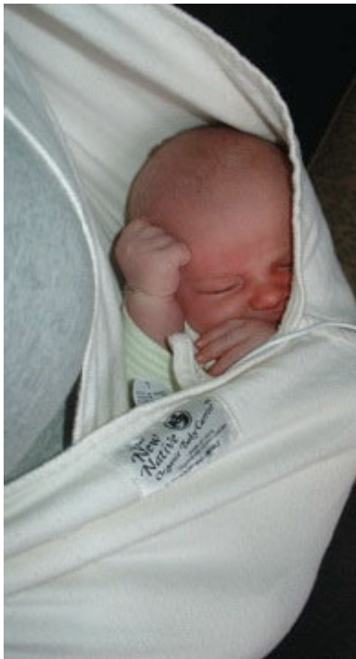
Ejemplo de un portabebé demasiado profundo y el bebé está demasiado hundido, sin usar toalla debajo.