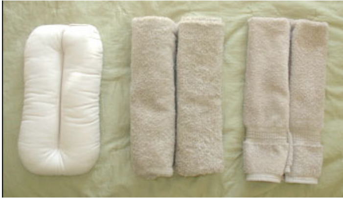
Ejemplos de toallas dobladas

La profundidad de la bolsa y / o el tamaño del bebé es lo que determinará si una toalla de baño o toalla de mano se debe utilizar.